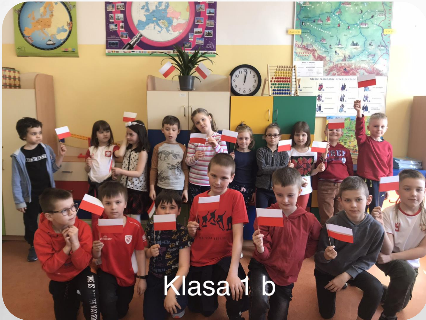
Klasa 1 b