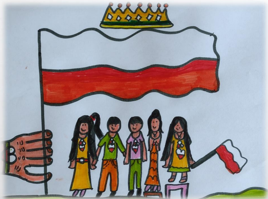
Oliwia Głód 3b