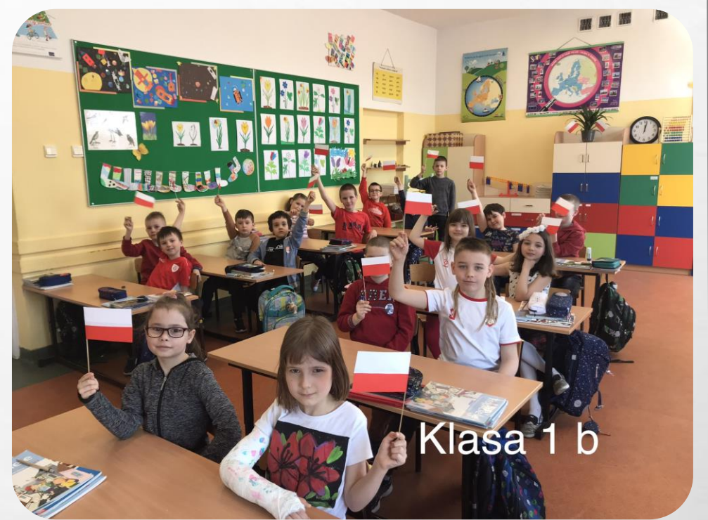
Klasa 1 b